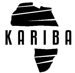
Ambasciata del Mozambico presso la Santa sede